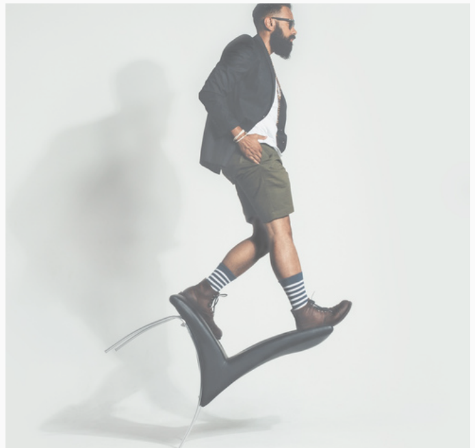
Neue Balance, neue Wege, neue Energie für Leadership und Self-Leadership

Nutzen Sie die kompakten Workshops, um beispielsweise disruptive Veränderungen bewusst und nachhaltig in die Unternehmensentwicklung und -kultur aufzunehmen und positiv zu entwickeln.