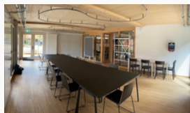
Methodische Zusammenarbeit in modernen Seminarräumen